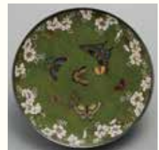
並河靖之《桜蝶圓平皿》明治時代 京都国立近代美術館

京都国立近代美術館が所蔵する、明治~昭和初期の工芸品および関連する絵画作品をご紹介します。 ※会期中一部作品・資料の展示替えがあります。