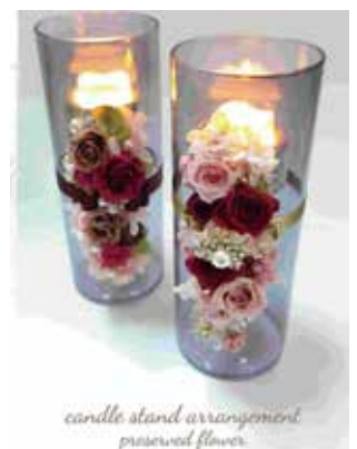
candle stand arrangement preserved flower