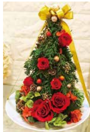
クリスマスツリー