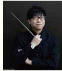
指揮:カーチン・ウオン

エルガー: 行進曲「威風堂々」 エルガー: チェロ協奏曲 チャイコフスキー: 交響曲第5番