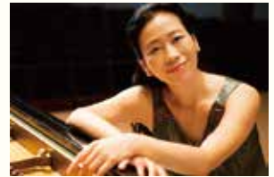
ピアノ: 小山実稚恵