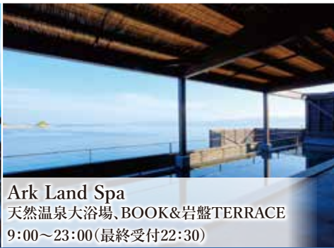
Ark Land Spa 天然温泉大浴場、BOOK&岩盤TERRACE 9:00~23:00(最終受付22:30)