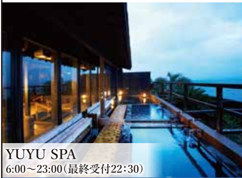
YUYU SPA 6:00~23:00(最終受付22:30)